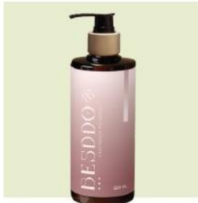
香氛朵朵柔順護色髮浴 500ml 保濕護色，柔順蓬鬆 適合：染後乾澀/毛躁打結/想要光澤感