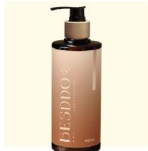
水潤深層護髮素 500ml 保濕鎖水，柔順光澤有彈性 適合：乾燥毛躁/髮尾打結/所有髮質