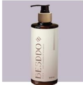
蓓淨角質淨化髮浴 500ml 頭皮像被打開的透氣感 適合：頭皮屑/悶癢