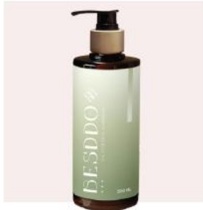
深層控油平衡髮浴 500ml 清爽控油，髮根更輕鬆 適合：油塌/悶味/下午容易貼頭